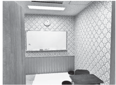
壁紙を貼って、教室が「ジブリ部屋」（洋館の一室）に生まれ変わりました。