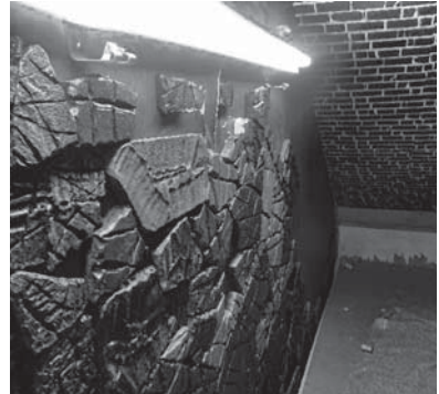
倉庫は「ダンジョン（地下牢）」に見立て、断熱材をはんだごてで溶かし、色付けして岩壁風に。

「教育とエ ンターテイメ ントの境目を どこまでなく せるか」を問 い続け、試行 錯誤している アミューズメントな学級です。